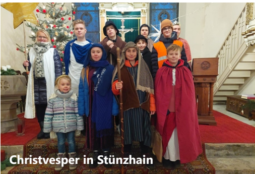
Christvesper in Stünzchain