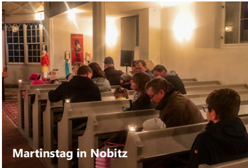
Martinstag in Nobitz