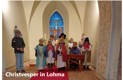
Christvesper in Lohma