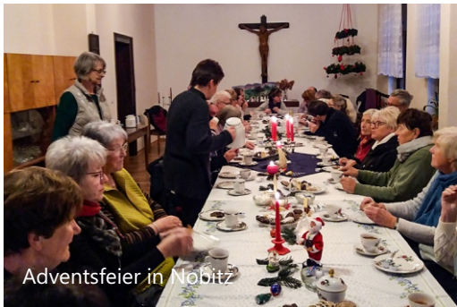
Adventsfeier in Nobitz