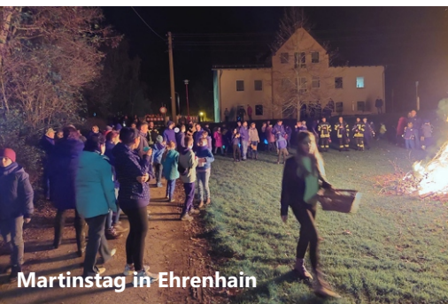
Martinstag in Ehrenhain