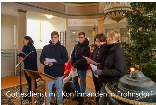
Gottesdienst mit Konfirmanden in Frohnsdorf