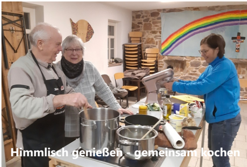
Himmlisch genießen - gemeinsam kochen