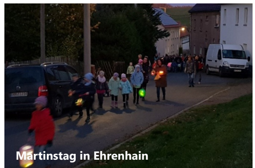
Martinstag in Ehrenhain