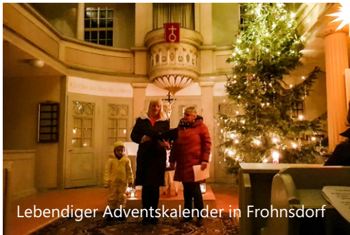
Lebendiger Adventskalender in Frohnsdorf