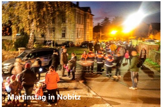
Martinstag in Nobitz