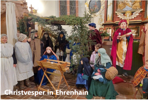
Christvesper in Ehrenhain