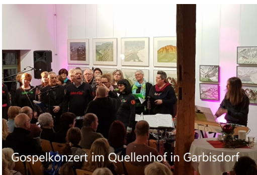
Gospelkonzert im Quellenhof in Garbisdorf