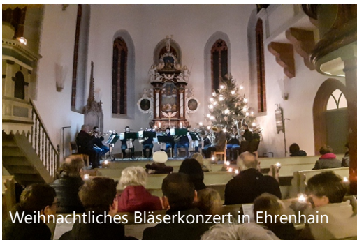
Weihnachtliches Bläserkonzert in Ehrenhain