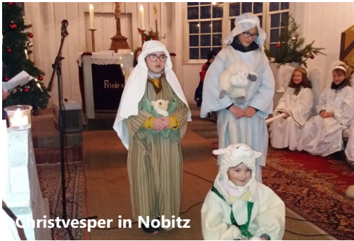
Christvesper in Nobitz