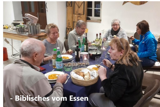
- Biblisches vom Essen