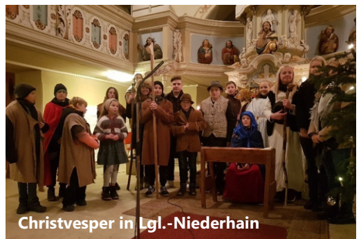
Christvesper in Lgl.-Niederhain