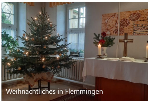
Weihnachtliches in Flemmingen