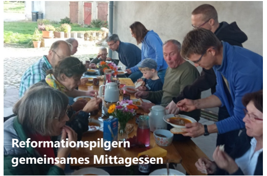
Reformationspilgern gemeinsames Mittagessen