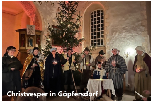
Christvesper in Göpfersdorf