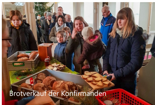
Brotverkauf der Konfirmanden