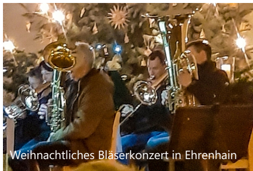
Weihnachtliches Bläserkonzert in Ehrenhain