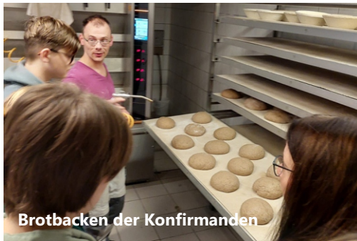
Brotbacken der Konfirmanden